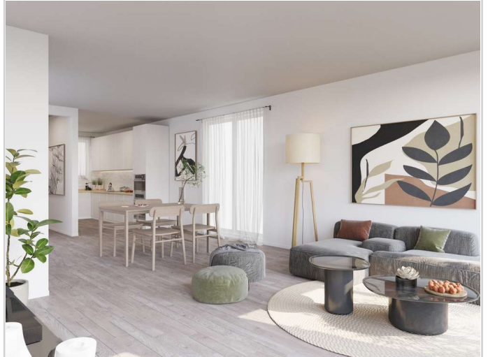
Livingroom and kitchen